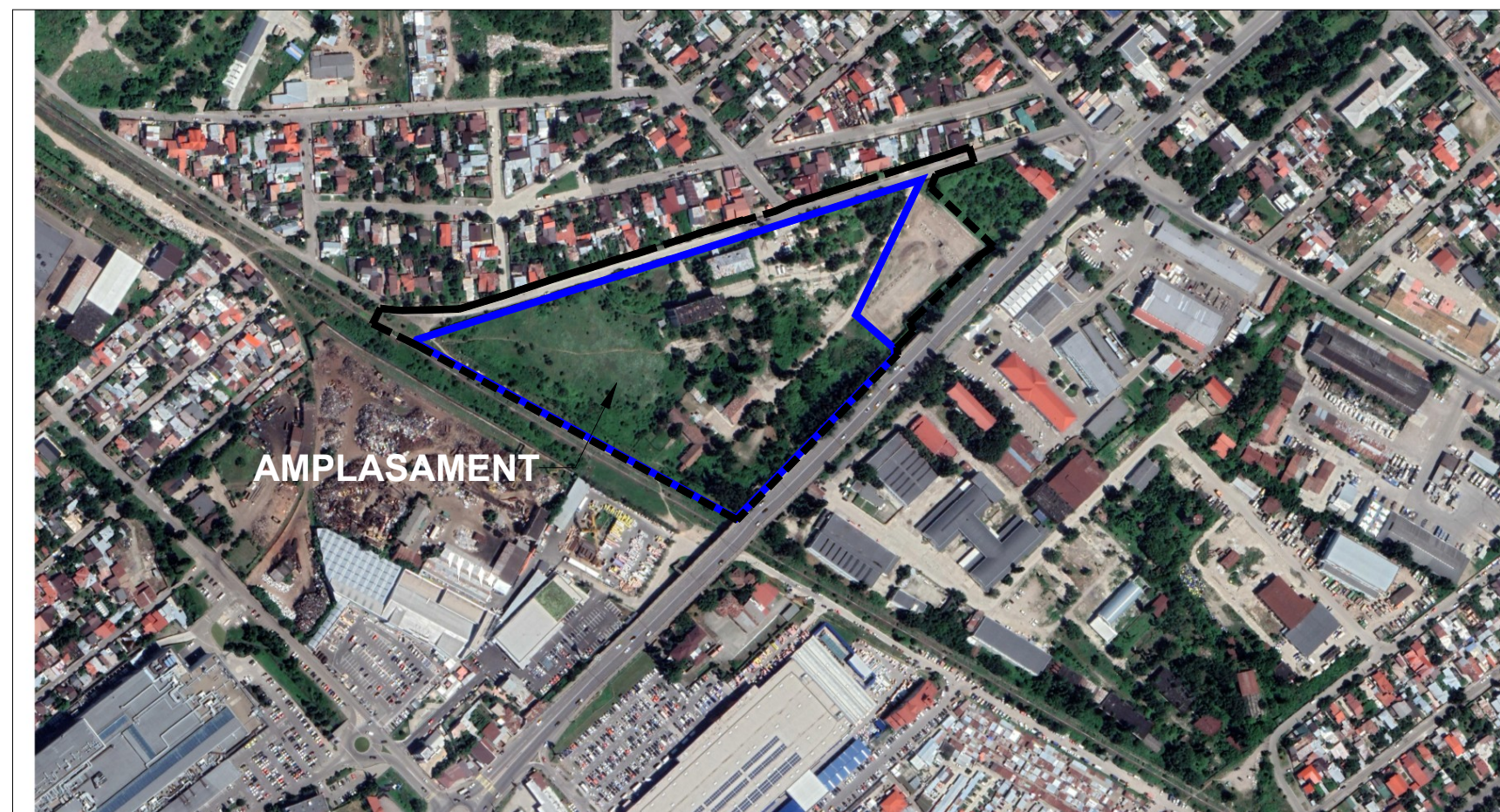
INCADRARE IN SATELIT 1:5000