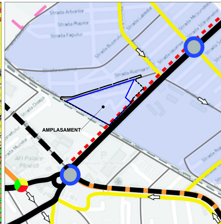
SISTEMATIZARE RUTIERA 1:10000